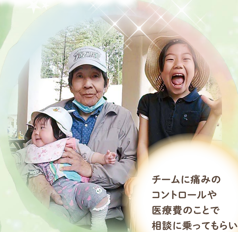
チームに痛みのコントロールや医療費のことで相談に乗ってもらい