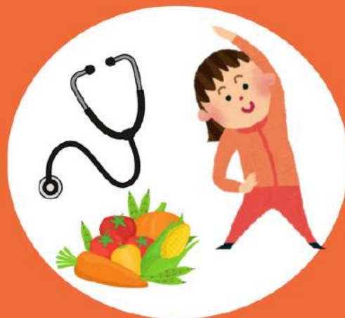
健康・栄養相談 運動アドバイス